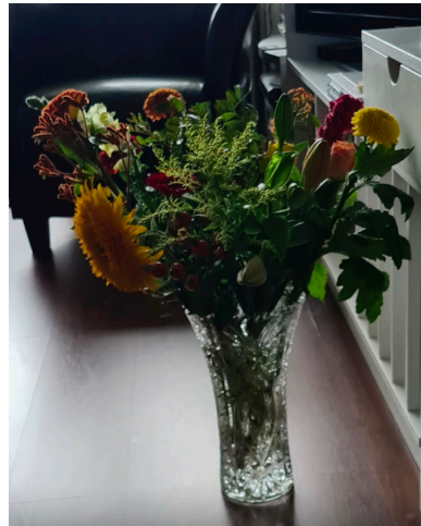
Wat mooi, en wat lief. Hartelijk bedankt voor jullie prachtig bouquet, heel lief 🌸🌻