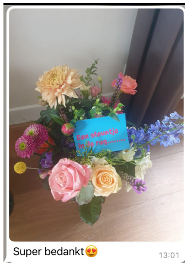
Super bedankt 😊